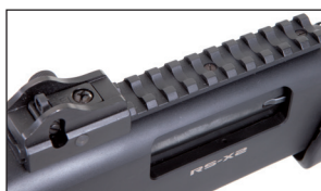
Mire précise montée sur le corps qui possède un rail Picatinny pour les optiques. Accurate rearsight mounted on body and Picatinny rails in order to mount optic.