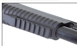
Rail Picatinny. Picatinny rail.