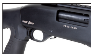
Sécurité facile à manipuler. Safety easy to handle.