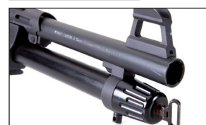
Chokes interchangeables. Interchangeable chokes.