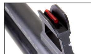
Guidon lumineux en fibre optique. Bright front sight with optic fiber.